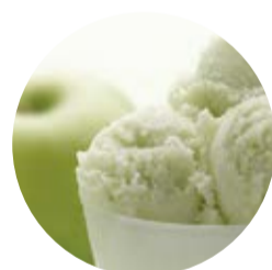
Mela verde Green apple