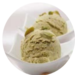
Pistacchio di Sicilia Pistachio