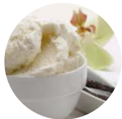
Vaniglia del Madagascar Madagascar Vanilla

Noi di Menodiciotto selezioniamo accuratamente gli ingredienti per creare gusti sempre naturali e raffinati che sapranno sorprendervi. Their taste and creamy texture will surprise your taste buds for a nourishing snack, a sweet indulgence or a noteworthy dessert.