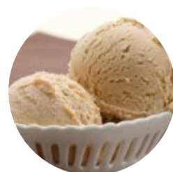
Nocciola del Piemonte Hazelnut