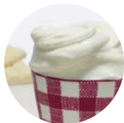
Cioccolato bianco White chocolate