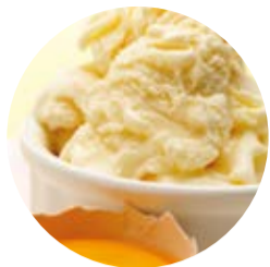
Crema all'uovo Egg Custard