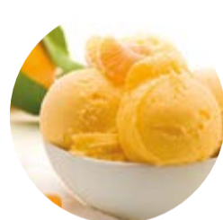
Mandarino tardivo di Ciaculli Mandarin late rapi from Ciaculli